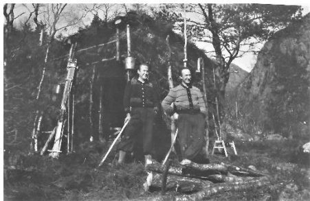
Hytta var godt kamuflert i terrenget. Vi ser skiene oppover hytteveggen, og utenfor henger det et par spann, og på marka har de en sagkrakk og noen tømmerstokker ligger i forgrunnen. Alle vegger og tak dekket med torv, og med reisverk som holder torva på plass – enkelt og greit, og sikkert ganske lunt innvendig.