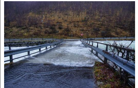
Storflaumen i Bjerkreimselva 2015. Vannet går over Hegelstadbrua.